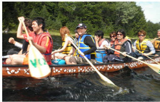
Waterfront Boat Cruise